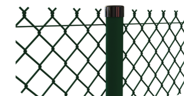
PLASTIGRAF voir p 26