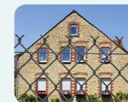
GRILLAGE SIMPLE TORSION GALVANISÉ GALVEX PAGE 40