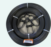
ACCESSOIRES DE POSE PAGE 25