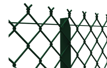
POTEAU T voir p 22-23