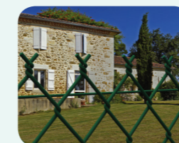
GRILLAGE SIMPLE TORSION FLUIDISÉ FLUIDEX PAGE 38